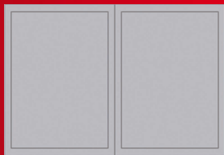
DOBLE PÁGINA 330mm x 480 mm